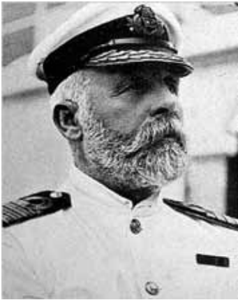
© Beveridge / Titanic: The Magnificent Ship