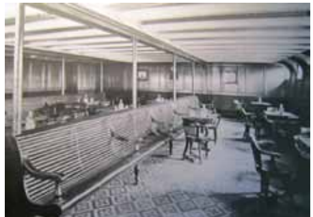
© Beveridge / Titanic: The Magnificent Ship