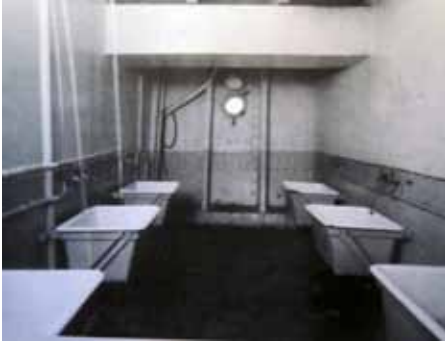
© Beveridge / Titanic: The Magnificent Ship

Dirige toi vers le panneau « Une vie intense dans les espaces communs ».