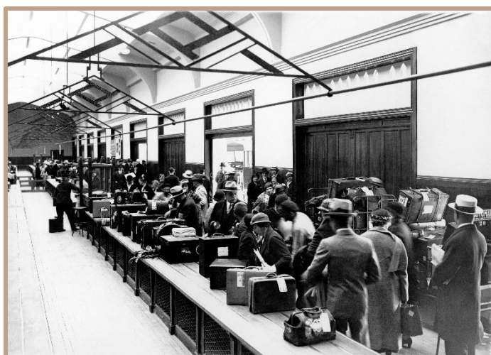
Le Hall des transatlantiques