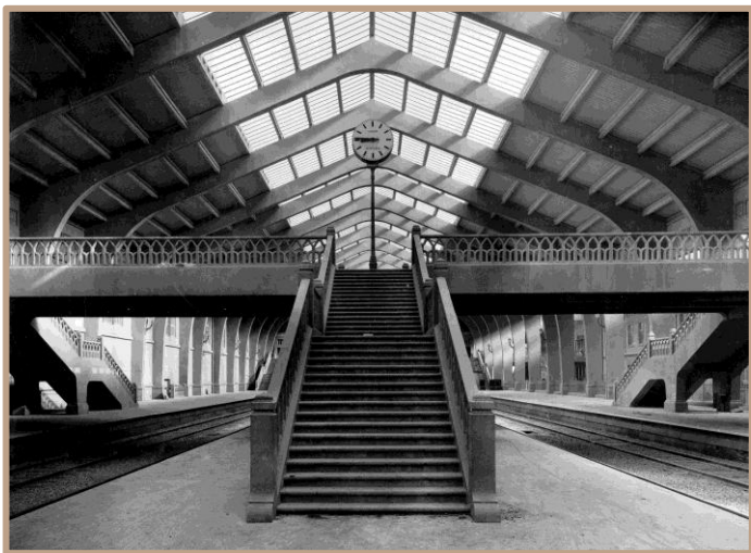
Le Hall des trains