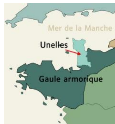
Le territoire des Unelles