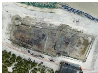
Champ de fouilles, 2012

Les premiers vestiges gaulois sur la plage d'Urville-Nacqueville apparaissent à la fin du 19 e siècle avec :