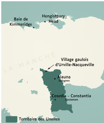
Le village d'Urville-Nacqueville